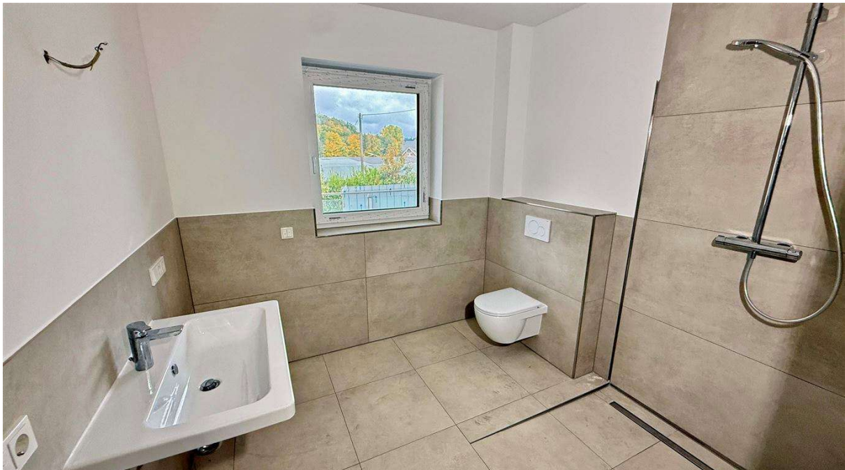
...alters-/ rollstuhlgerechtem Bad