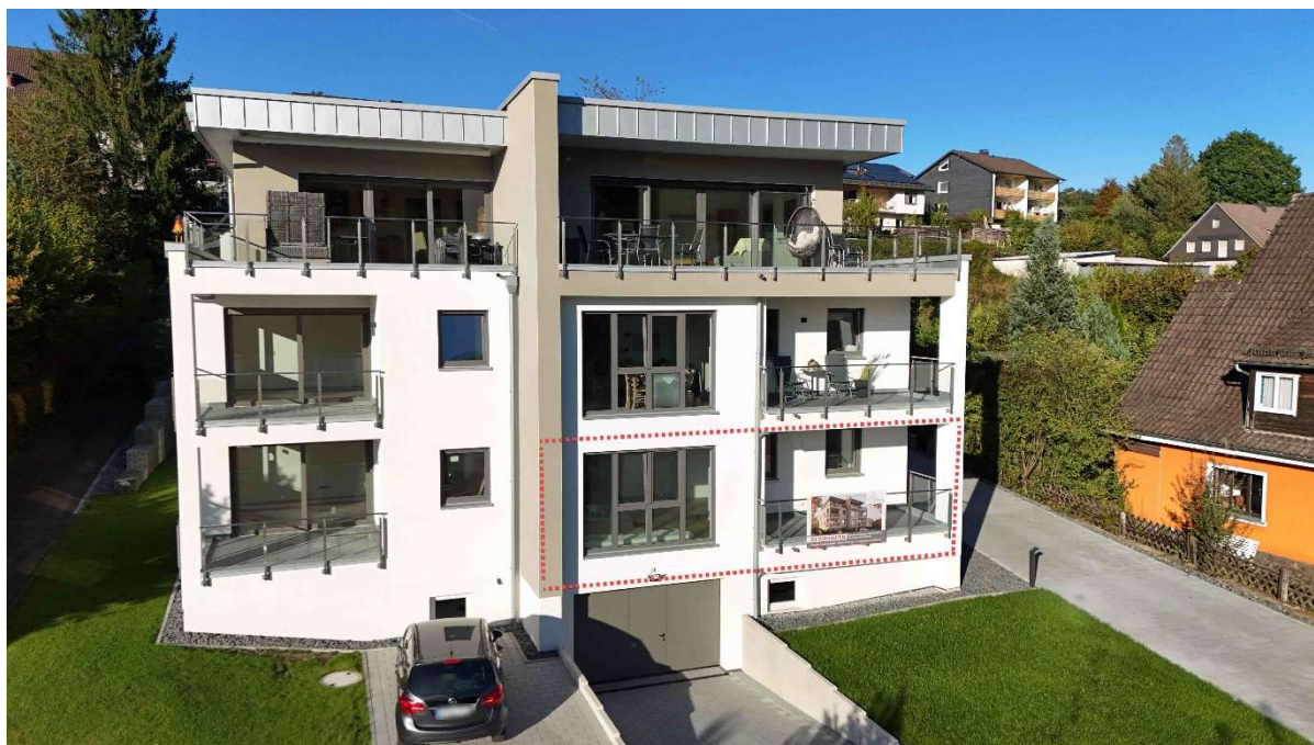
68 m 2 in der Parterre rechts