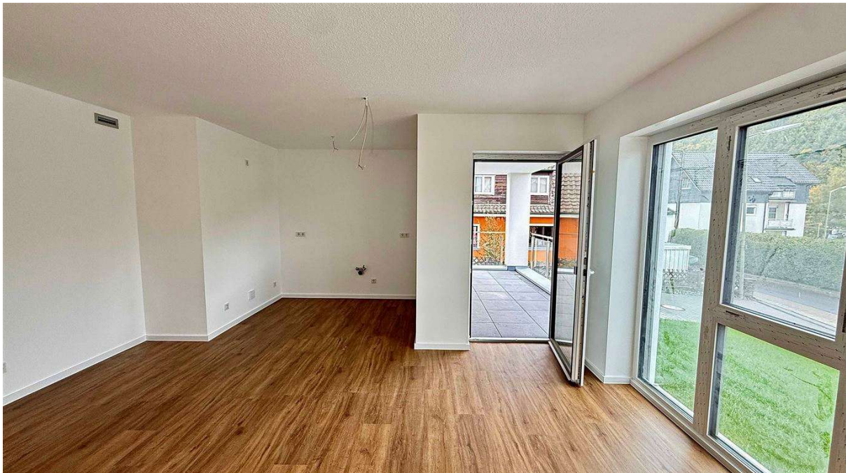
Wohn-/ Esszimmer 27,8 m 2 mit Loggia 10,8 m 2