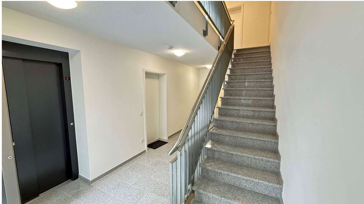
gepflegtes Treppenhaus mit Natursteinböden- / Treppe