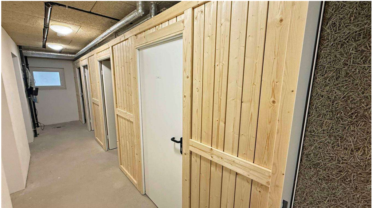
Zur Wohnung gehört ein Kellerabteil