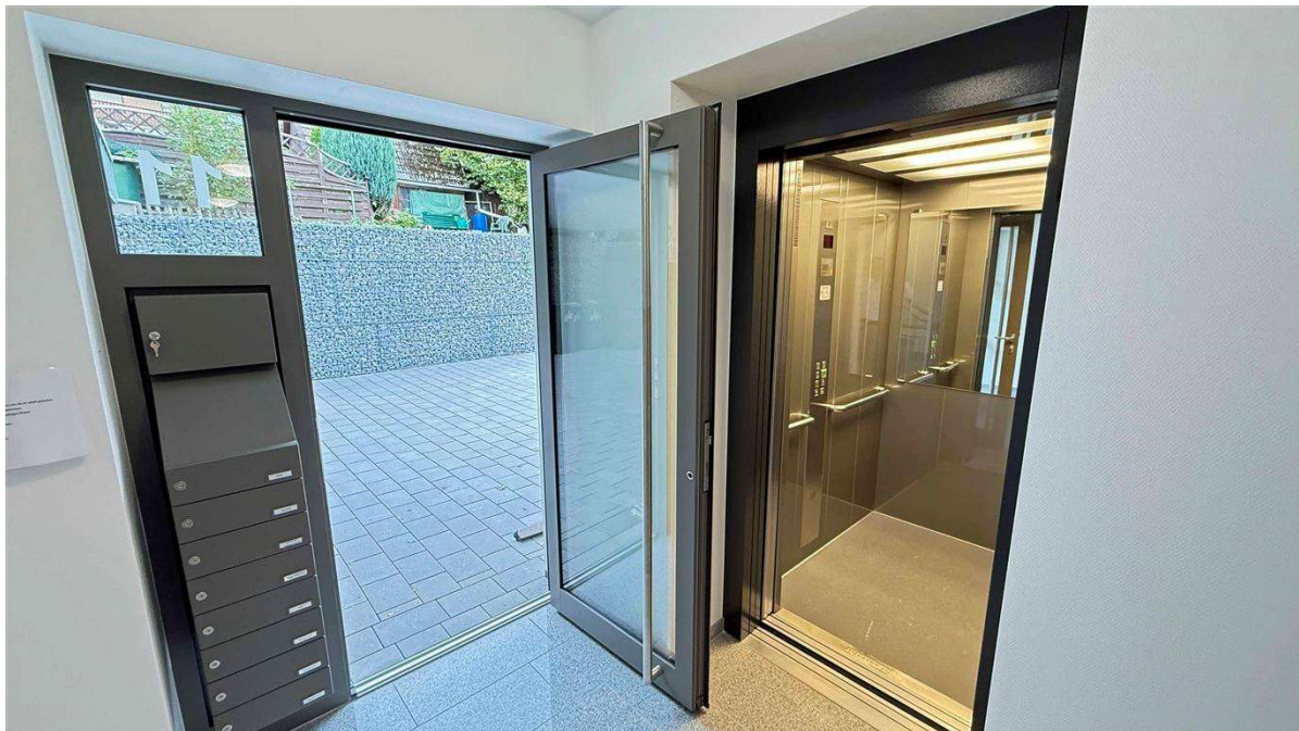
Eingangsbereich mit Aufzug