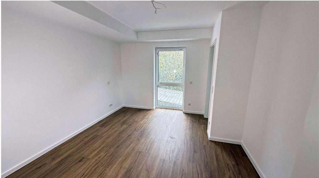
Schlafzimmer 15,35 m 2 mit angrenzendem...