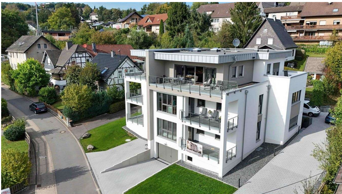
schöne Wohnlage in Morsbach, nur 400 m vom Ortskern